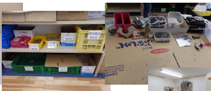
<小型家電製品の解体>